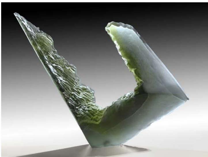
espape I (Auflicht)