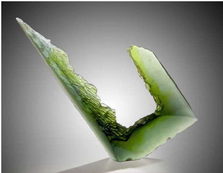
espape I (Durchlicht)